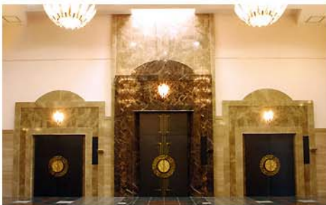
特別殯館・特別室

季節の草花をモチーフにした ステンドグラスが光を招く、 現代的感覚を取り入れた火葬棟。